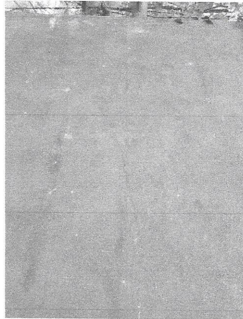
Foto 2. Vista de la grieta provocada por el Guanacaste que aún está en crecimiento.