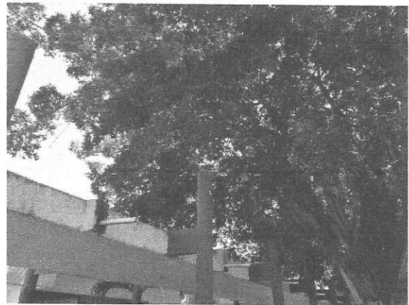
Foto 4. Las ramas de los Ficus ya llegan hasta los edificios cercanos.